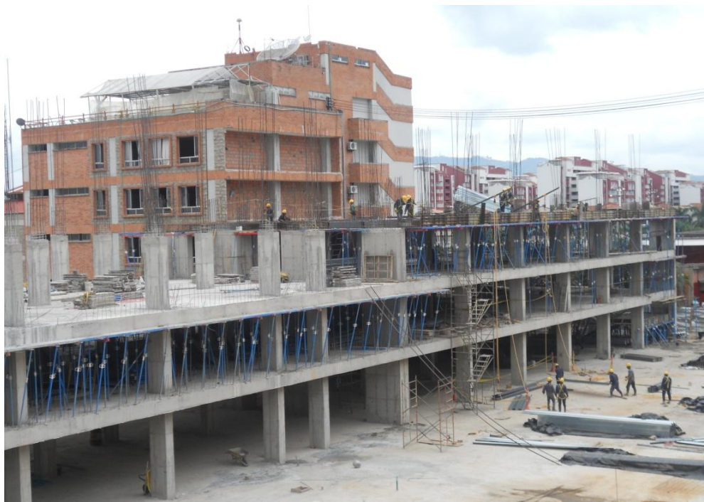
UNIDADES TECNOLÓGICAS DE SANTANDER